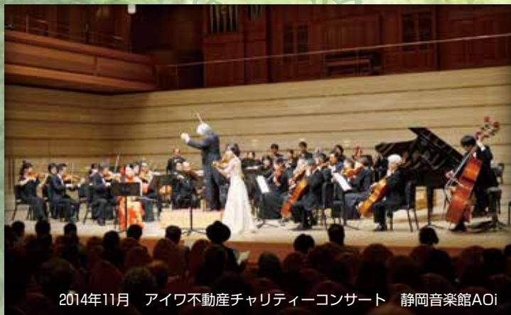
2014年11月 アイワ不動産チャリティーコンサート 静岡音楽館AOI